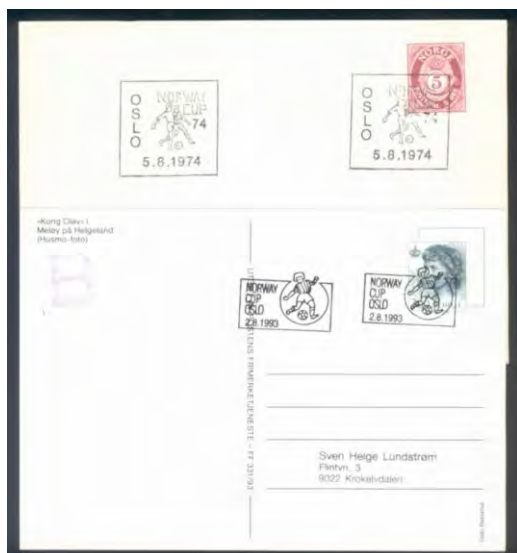
Bilde 7. Norway Cup, fotballturneringen for ungdom på Ekebergsletta hadde i årene 1972 - 1995 motivstempel. I en del år var bestillingsadressen Lambertseter postkontor.

I 1971 innførte Frimerketjenesten «Frimerkets Dag» med frimerkeutgivelse, eget stempel og gjerne en propagandautstilling i samme forbindelse, fra fredag til søndag. Aktiviteten har med årene blitt redusert til frimerkeutgivelse og et motivstempel som postkontorene knapp visste at de hadde fått tilsendt (ref min artikkel i INFO 4/2001), men i løpet av noen år hadde mange postkontor eget FD stempel. På det verste hadde alle Oslos 62 postkontor eget FD stempel. Hvor mange av disse som virkelig ble benyttet er det vel ingen som har full oversikt over, men for årene 1990-1996 var det noen som bestilte stempler fra alle postkontor. I dag får kun Pft, Grensen og Stovner eget FD stempel. Alle andre postkontorene får utdelt et stempel uten stedsangivelse som må sidestemples for å vise hvor det var brukt.