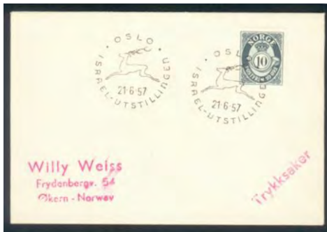
Bilde 5: Israel-utstillingen i 1957. Utstilling av israelske frimerker, bøker og grafikk i Kunstnernes Hus.