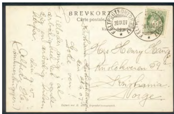
Bilde 1: Eksempel på de tidligste særstempler, Feltpostkontor no. 17 til Landbruksutstillingen i 1907

Siden 1892 har det vært benyttet motivstempler i Oslo, mange bestilt fra forskjellige organisasjoner i forbindelse med utstillinger og kongresser. Tungt inne har filatelistklubbene vært og da spesielt på 1970/80 tallet hvor det var mange frimerkeutstillinger og aktiviteter. Vi har vel alle trasket i vei til Håndverkeren, Samfunnshuset, Oslo Kommunes informasjonssenter og Folkets Hus for en frimerkeutstilling eller -messe. Stemplene florerte og vi kjøpte villig vekk.