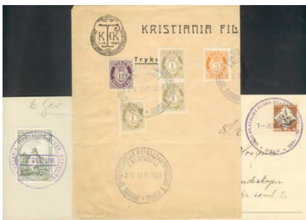
Bilde 3: Kristiania Filatelist Klubs utstillinger i 1918 og 1924 samt Oslo Filatelist-Klubb's utstilling i 1930

Det første stempel som kan betegnes som motivstempel kom til OFKs utstilling i 1942 «Frimerkets Uke» som viser Akershus Slott i motivet. Dette var et unntak. De etterfølgende stemplene hadde igjen ren tekst og ingen motiv. Først på 1950 tallet dukker det opp noen motiv i stemplene, men det er rundt 1960 at vi ser rene motiv i sentrum av stemplene.