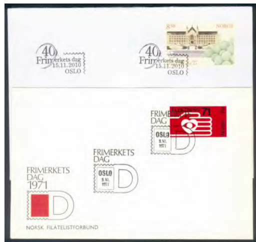
.Bilde 6: Frimerkets Dag, de første årene var dette kun en dags arrangement, mens det senere gikk over inntil 3 dager. I forbindelse med FD var det gjerne en propagandautstilling.