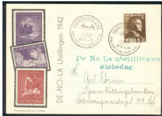
Bilde 4: Det første motivstempel, med Akershus festning, benyttet under OFKs utstilling Frimerkets Uke i perioden 29.10 – 5-11-1942.