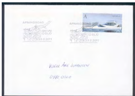
Bilde 16: Idrettsarrangement har gjennom årene blitt avbildet på motivstempler, sist ute var VM i nordiske grener (Ski-VM) i 2011 med 12 forskjellige motivstempler, et for hver dag.

Om mine oversikter er korrekt er det i skrivende stund benyttet 490 forskjellige sær- og motivstempler i Oslo. Flere stempler har vært benyttet over flere dager, om det har vært benyttet stempler med fast dato eller bevegelig datotall er ukjent, men uansett blir dette et vanvittig område om alt skal samles.