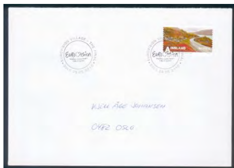
Bilde 15: Eurovision Song Contest i Oslo, men selve arrangementet foregikk i Telenor Arena på Snarøya i Bærum Totalt var det 11 forskjellige stempler.

Fjorårets «Must see program» på TV «Eurovision Song Contest» fikk stempler som ble benyttet både i Oslo og på Fornebu, totalt ble det 7 stempler i Oslo.