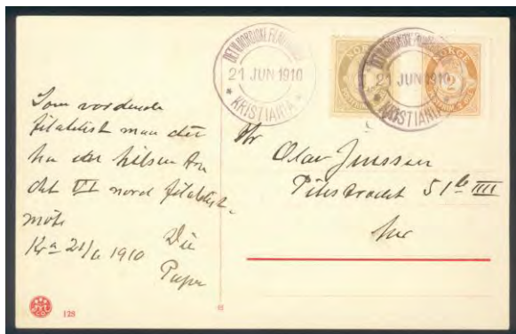
Bilde 2: Første særstempel relatert til filateli, nemlig det 6. nordiske frimerkemøte i Kristiania 20. – 22. juni 1910.