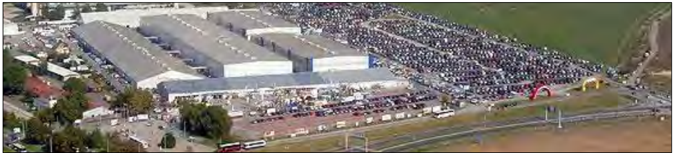
Oversikt over messeområdet Sberatel.

Deltagerne kan selv bestemme om de reiser ned for hele eller deler av perioden, eller utvider turen med andre gjøremål. Praha er en flott by som en lett kan bruke noen dager på å gjøre.