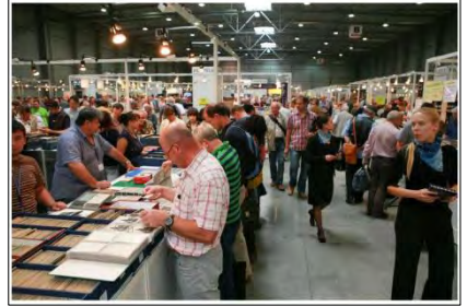
Fra messehallen i september 2012

OFK bestiller hotell for de som ønsker å delta, mens deltagerne selv bestiller reisen til/fra Praha. Vi prøver å finne et hotell som ligger sentralt i Praha.