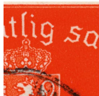
T61 v2 Rød flekk i G (10/2)