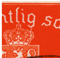
T61 v1 Hvit strek mellom G og kronen

Varianten vil normalt kunne finnes i midten av utsnittet. Hvis varianten finnes helt ute i kanten av merkebildet, vil man se den i midten på en av kantene.