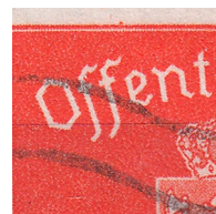
T61 vx4 Prikk i hvitrand over F i OFFENTLIG