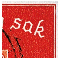
T61 v3 Ytre høyre ramme tynn i høyre øvre hjørne (28/2)