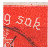
T61 vx5 Prikk i hvitrand over A i SAK