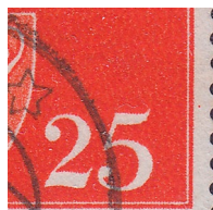
T61 vx2 Prikk i hvitrand ut for fane på høyre 5 i 25