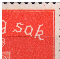
T61 vx1 Prikk i hvitrand over K i SAK