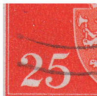
T61 vx6 Prikk i foten på venstre 2 i 25