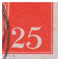
T61 vx3 Komma i nedre hvitrand ved høyre hjørne