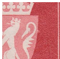
T82 vx7 Hvit flekk i overgangen våpenskjold og bunnfelt ca. kl. 02.50