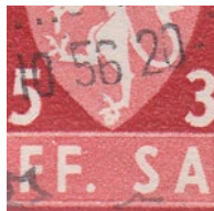
T82 v1 Kule under venstre fot (pos. 34)

Varianten vil normalt kunne finnes i midten av utsnittet. Hvis varianten finnes helt ute i kanten av merkebildet, vil man se den i midten på en av kantene.