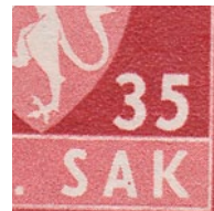
T82 vx3 Fargeflekk på A i SAK