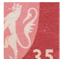
T82 vx8 Hvit flekk til høyre for våpenskjold kl. 03.00