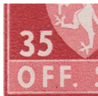
T82 vx10 Fargeflekk nede mellom FF i OFF.