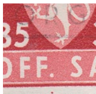
T82 vx5 Fargeflekk i nedre hvite marg under punktum