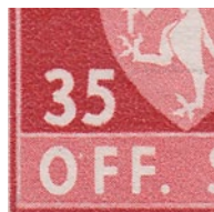
T82 vx12 Hvit flekk bak O i OFF kl. 02.00