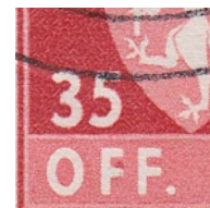
T82 vx14 Fargeflekk på andre tverr- strek på første F i OFF