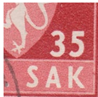
T82 vx2 Fargeflekk nedre felt i høyre side