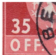
T82 vx11 Fargeflekk nede til høyre på O i OFF.