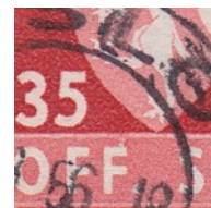
T82 vx9 Flekk i overkant på andre F i OFF