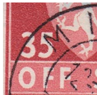
T82 vx1 Fargeflekk på O i OFF kl. 10