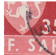
T82 vx4 Hvit utløper på S i SAK